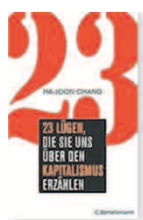
Ha-Joon Chang 23 Lügen, die sie uns über den Kapitalismus erzählen Bertelsmann 380 S., 14,99 Euro

Chang mit dem Hinweis, die Einführung der Telegrafie – oder der Waschmaschine – habe den Lebensalltag vieler Menschen viel stärker verändert. Wohlwundert sich Chang gegen die pessimistische These, der Eigennutz des Menschen sei nun einmal dessen stärkste Antriebsfeder und nach diesem Prinzip möge doch die gesamte Wirtschaft funktionieren. „Geht man von dieser Selbstsucht aus, so versucht jeder Ladenbesitzer, seinen Kunden übers Ohr zu hauen, jeder Arbeiter, sich um Arbeit zu drücken“.