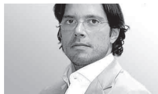
VON PHILIPP HAIBACH