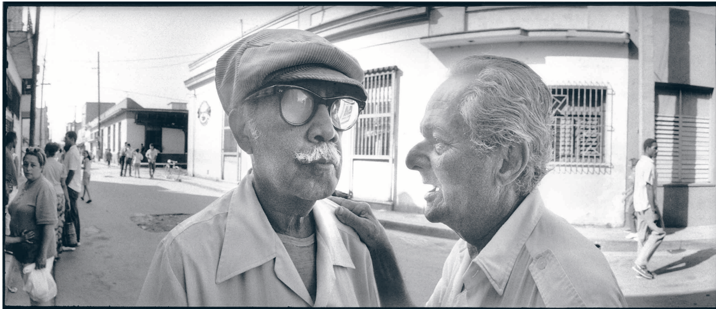
Camagüey, Kuba, 1994: „Die zwei Alten stehen mitten auf der Straße. (...) Sie quatschen und lachen.“

Er nimmt eine flüchtige Bewegung aus dem Augenwinkel wahr und lässt sich von ihr gefangen nehmen. Sein Blick verengt sich und schält die Einmaligkeit des Moments heraus. Stefan Enders seziert die Straße, stoppt den Alltag für den Bruchteil eines Moments mit einem Klick. Nach dem Studium an der Kunstakademie Düsseldorf verlegte sich Enders, der in Köln lebt, immer mehr auf die Fotografie. Über 20 Jahre lang schoß er Reportagen für Magazine wie Der Spiegel , Focus , Geo und Merian , heute lehrt er als Professor für Fotografie an der Fachhochschule Mainz. Seine Motive für den aktuellen Band fand er auf Kuba, in Istanbul, Burma, Manila, Venedig, London, Mexiko und schließlich Israel. Die Menschen, die Stefan Enders zufällig vor die Linse laufen, werden von ihr überrascht und ein Stück nackter entlassen. Der Fotograf entblättert die flüchtigen Bekanntschaften, streicht das Unwesentliche und legt so den Kern frei. Was bleibt, ist der unverstellte Blick auf Szenen, die trotz des Settings keineswegs alltäglich sind. Am stärksten sind Enders Bilder dann, wenn der Portraitierte sich unbeobachtet wähnt und allein die Betrachtung des Bildes den Hauch von Voyeurismus birgt. So nehmen wir teil, wenn ein müder Koch sich in einer venezianischen Gasse eine kleine Auszeit erschleicht, während sich der Novembernebel über die Lagunenstadt legt. Eindrücklich auch das Gruppenbild mit Dame aus Tel Aviv: Auf der belebten Strandpromenade wirft sich ein al-