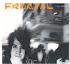
Stefan Enders Frontal Moser 132 S., 49 Euro

Auslöser und überfällt schonungslos. Der Fotograf schießt selten mit Vorwarnung, meist wird das Abbild des Ahnungslosen ungefragt gebannt. Dafür nähert sich Enders seinen Objekten bis auf wenige Zentimeter und schafft so eine Distanzlosigkeit und Realität, die sich eindrucksvoll bis in die Betrachtung rettet.