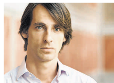
Angekommen in der Mediengesellschaft: Diskussionsleiter Richard David Precht

stimte Voraussetzungen geschaffen sein: Wir müssen bewusst und reflektiert handeln statt affektiv und spontan. Wir müssen in den Spiegel schauen, um das eigene Ich als Korrektiv agieren zu lassen. Und letztlich muss unsere Bezugsgruppe gute Taten belohnen und bestärken. Dies arbeitet Precht dankenswerterweise heraus: Der Druck der Gruppe auf die moralische