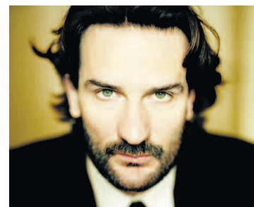
Beigbeders Motto: „Die Lage ist verzweifelt, aber nicht ernst“

Der eine kämpft, der andere kokst. Das zeigt den ganzen Unterschied. Vom Heroismus zum Hedonismus führt der Weg. So will es Frédéric Beigbeder, so stellt er es zumindest dar. Der Großvater, dem er gleich im ersten Kapitel ein kleines Epitaph errichtet, fiel im Ersten Weltkrieg, am 25. September 1915. Der Nachfahre, unmittelbar danach eingeführt, wird am 28. Januar 2008 auf offener Straße in Paris festgenommen, weil er sich auf der Kühlerhaube eines Autos seine Linie reingezogen hat. Der Untergang des alten Frankreichs ist damit perfekt. Beigbeder ist ein mit allen Wessern der Postmoderne gewaschener Spieler, der sehr wohl weiß, dass er mit literarischen Mustern, mit kulturgeschichtlichen Versatzstücken hantiert. Und doch. Trotz allem Spaß an Zuspitzung und Persiflage ist dieses neue Buch des französischen Romanciers und Tausendassas Beigbeder, der nach Michel Houellebecq außerhalb Frankreichs meistgelesener Gegenwartsautor seines Landes ist, ein ernstgemeintes Buch der Selbstgewissheit. Nun gut, der märchenhafte Schluss muss ebenso wenig für bare Münze genommen werden wie die vielen anderen erzähltechnischen Fahrten, die der Autor legt. Als witzige Parodie auf den „französischen Roman“, Abteilung Individualitätsgeschichte, ist seine Lektüre sehr vergnüglich. Beigbeder gibt sich dabei ganz als „Jahrhundertkind“ im Sinn Mussets mit sämtlichen Ingredi-