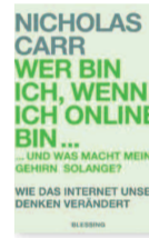
Nicholas Carr: Wer bin ich, wenn ich online bin ... und was macht mein Gehirn solange? Blessing 384 S., 19,95 Euro

Eben noch haben die Menschen ein Vorwort beigesteuert hat. Sie kommt unter dem Titel „Wer bin ich, wenn ich online bin, und was macht mein Gehirn solange?“ und mit serifenlosen grauen und grünen Buchstaben auf monochromem Grund daher. So wie ein Sarrazin zu glauben scheint, dass die (seiner Auffassung nach immerhin gloriose) deutsche Kultur in Untergangsfahrer gerät, falls zu viele Neuköllner Immigranten nicht das kleine Germanicum absolvieren, traut Carr dem (so fabelhaft plastischen) Gehirn nicht viel Resilienz gegen die Neuronenfresser aus dem Netz zu. Doch man rettet Texte nicht, indem man ihren Untergang beklagt und darüber jammert, wie schwer sie es haben. Sondern indem man die Mühe auf sich nimmt, Menschen von ihnen zu begeistern.