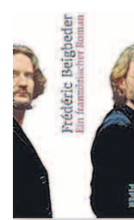
Frédéric Beigbeder Ein französischer Roman Piper 253 S., 18,90 Euro

ten auf Diskretion und Distinktion galten, gelingt dem Autor ganz vorrefflich. Auch wenn in Deutschland dieses Zivilisationsmodell nie so unangefochten gelolten hat, so erkennt doch selbst der deutsche Leser vieles wieder, was bei ihm ebenfalls verschwunden ist – immer vorausgesetzt, er ist also mindestens so alt wie der Verfasser, – und hat etwas anderes als unentwegtes Handygebimmel im Ohr.