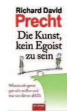
Richard David Precht: Die Kunst, kein Egoist zu sein. Warum wir gerne gut sein wollen und was uns davon abhält Goldmann 544 S., 19,99 Euro

wären wir wieder beim Staat. Der Rückzug des Staates ist für Precht Chance und nicht Gefahr. So fordert er eine Stärkung der Städte und die Abschaffung der Bundesländer. An dieser Stelle macht sein Buch wieder Spaß. Seine Idee, die deutschen Länder aufzulösen und den Bundesrat zu schließen, belebt eine leider eingeschlafene Föderalismus-Diskussion und hat in seiner Eindeutigkeit etwas Erfrischendes – auch wenn es sich vom Thema des Buches weit entfernt. Leider braucht er bis zu dieser Stelle über 400 Seiten.